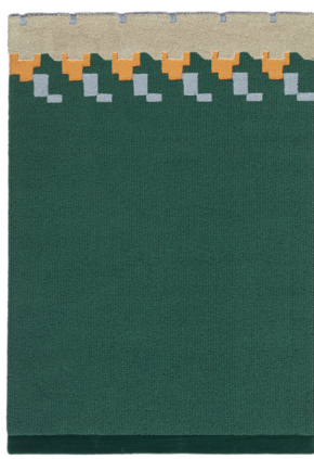
SW 02 Verde Saltellante

I dati forniti in questa scheda tecnica sono aggiornati al momento della pubblicazione. Carpet Edition si riserva il diritto di modificare materiali, dimensioni e caratteristiche senza preavviso. The data provided in these technical specifications are up to date at the time of publication. Carpet Edition reserves the right to modify materials, sizes and characteristics without notice.